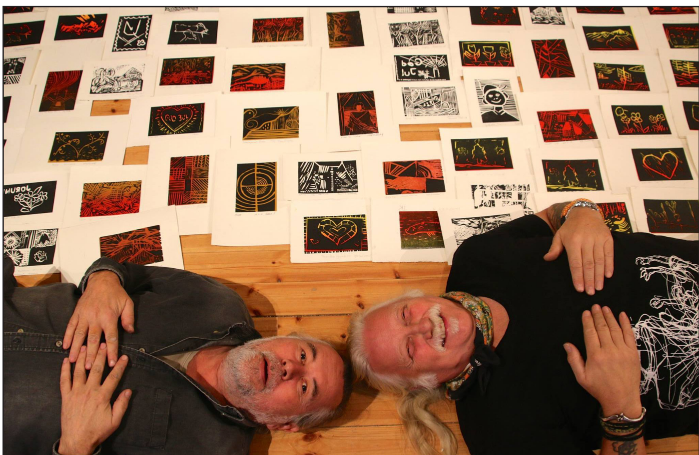
«Dialog Salten Senior – Minner på trykk»