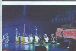
Mammaen vår. En siltten mamma med sine barn femtenlenger. Stykket var også tilpasset de minste, her som femten barn til en siltten mamma, også i år ni millioner ni hundre og nitti åtte tusen i Kr. fantes altså siltten mammaer!