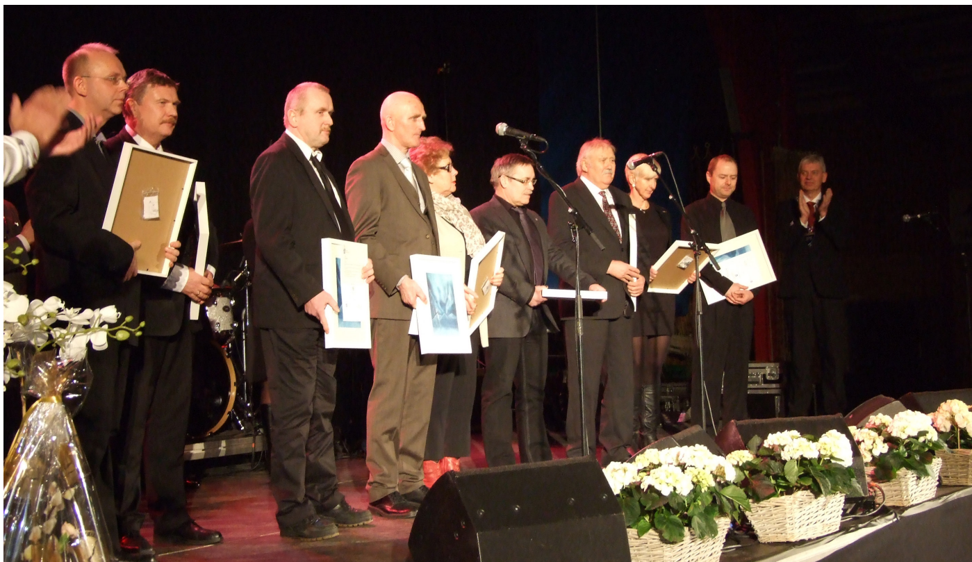
Idrettsgalla 2013 i Fauske Idrettshall

Målet er å arrangere Idrettsgalla annet hvert år.