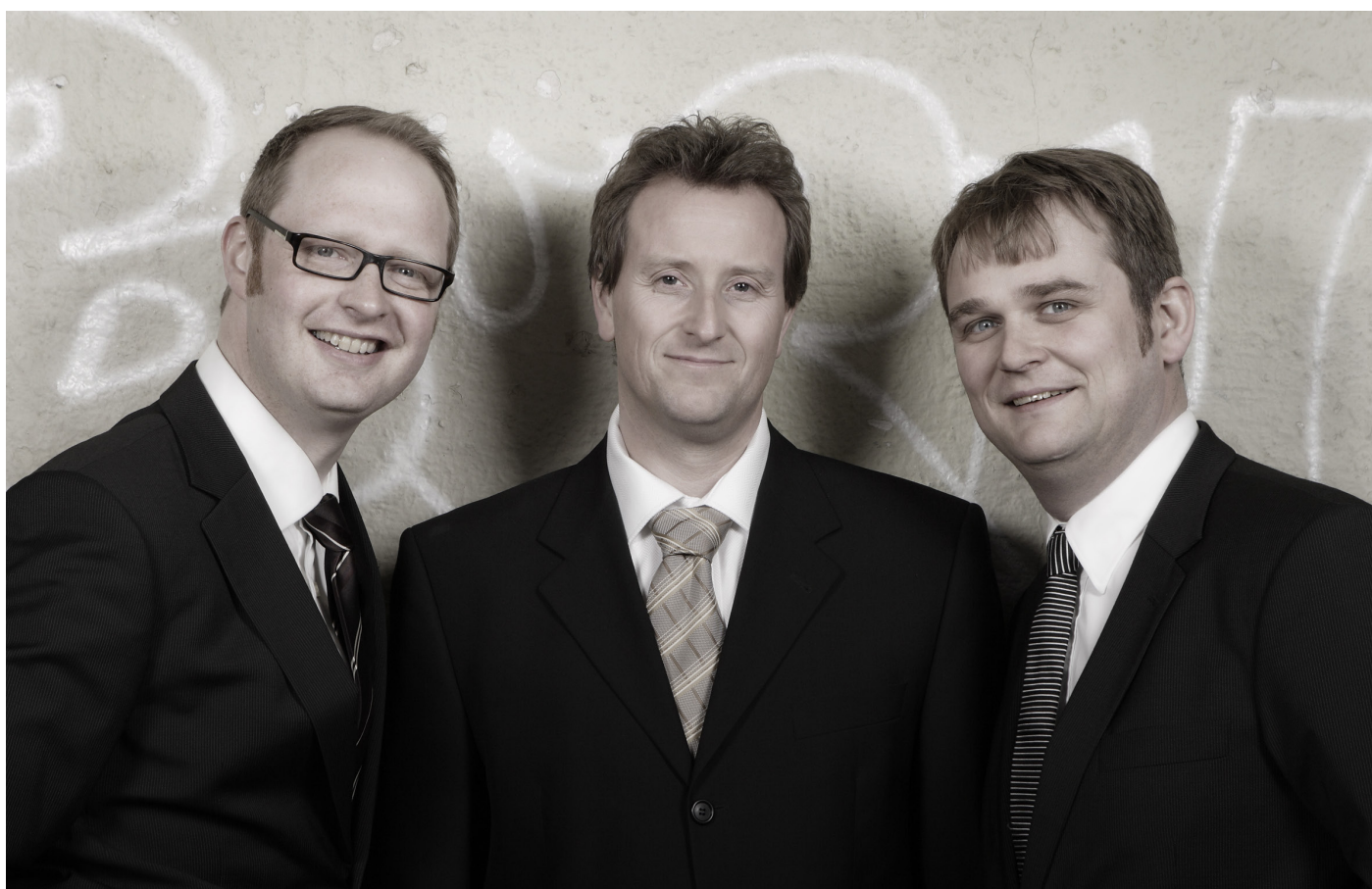
Den kulturelle spaserstokken: De nære ting - Sanger av Kurt Foss og Reidar Bø