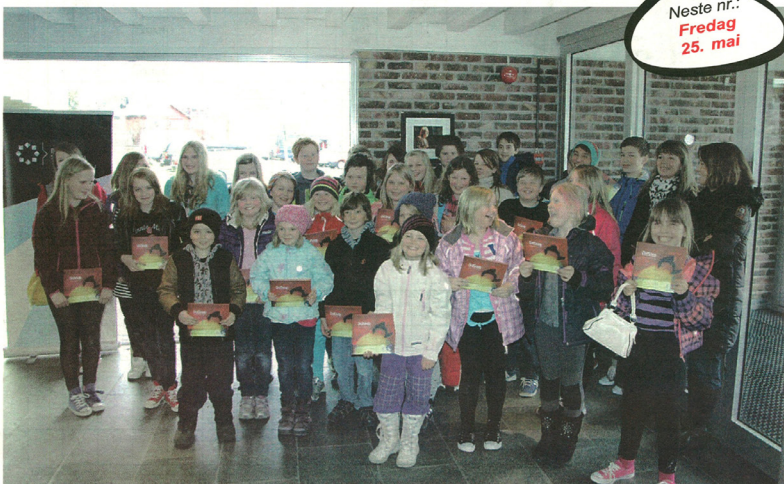
ORDSNOPERE. 30 deltakere fra Hamarøy med boka "Ordsnop" i hånda.