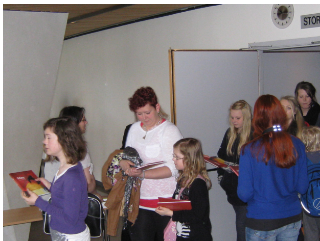
Fra publiseringsarrangement i Bodø Kulturhus