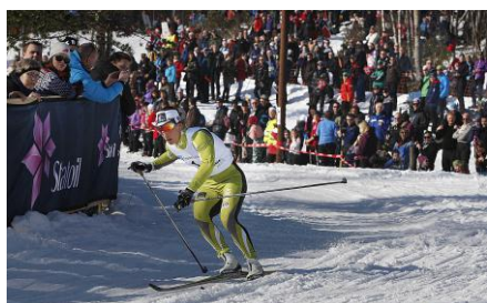
Fauske IL med NM del 2 på ski

"Det har i 2012 vært en rekke store arrangementer som virkelig har satt Salten på kartet. Årets arrangement ble arrangert på en knirkefri måte, og høstet velfortjent skryt fra flere hold. Med flere tusen tilskuere ble det en knallsuksess, og vinneren fikk da også velfortjent heder fra sentralt hold. Alt fra utøvere og trenere til tilskuere og mediefolk var rausere med godordene etter folkefesten som arrangementet sørget for. Fauske viste med dette arrangementet at de er en arrangørby i Norgestoppen. Det strålende været gjorde også sitt til at de 12.000 tilskuerne virkelig fikk en opplevelse de sent vil glemme i Klungsetmarka."